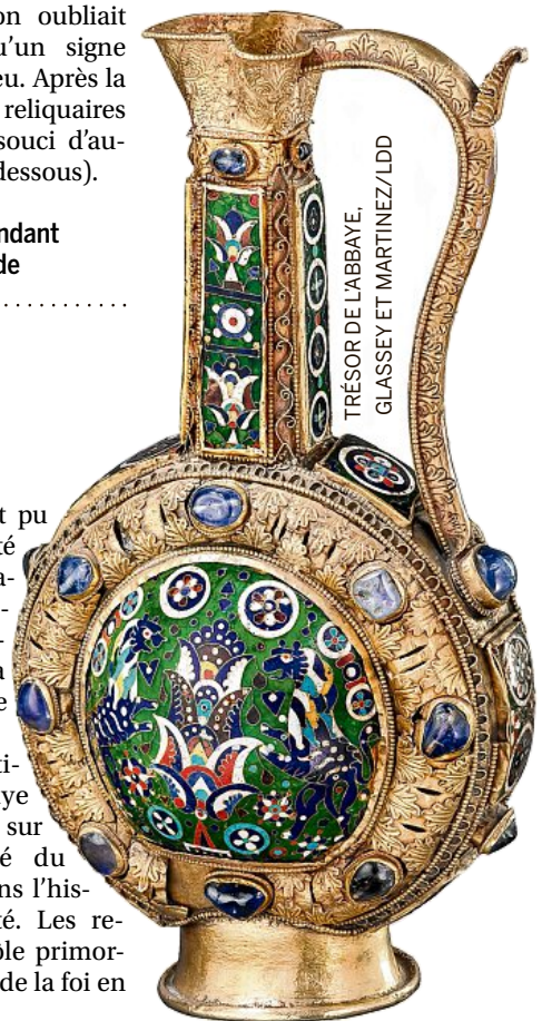
TRESOR DE L'ABBAYE.

Pour nous, les chanoines, les reliques restent toujours le cœur de l'abbaye. Nous poursuivons l'œuvre de témoignage de foi des martyrs et sommes très touchés de voir l'attention que portent nos visiteurs, surtout orthodoxes et coptes, pour ces reliques. Très sollicités, nous offrons encore régulièrement des reliques à des églises dédiées aux martyrs. Comme récemment à Saint-Maurice dans le Val-de-Marne, mais aussi dans les îles du Pacifique, à Madagascar ou plusieurs fois en Egypte, où les Coptes ont redécouvert «leur» martyr de Thèbes (Louxor). Nous avons d'ailleurs reçu en visite à l'abbaye leurs patriarches Chenouda III en 2004 et Tawadros II cette année. Aujourd'hui, nous recensons plus de mille églises dédiées à saint Maurice à travers la planète. I