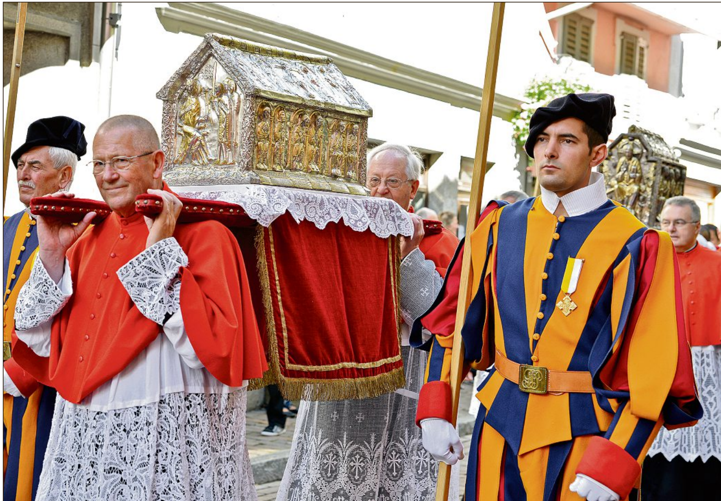
Le culte des reliques est resté bien vivant à Saint-Maurice. Le 22 septembre dernier, la traditionnelle procession des reliquaires (ici la châsse des enfants de saint Sigismond et celle de saint Maurice) a marqué l'ouverture des festivités des 1500 ans de l'abbaye.