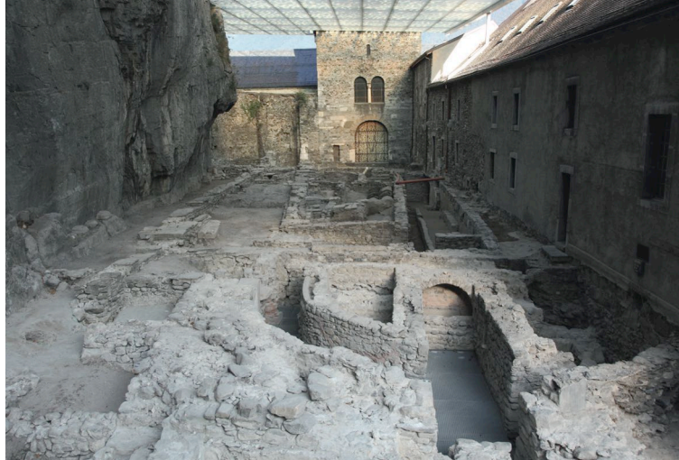
✚ Site abbatial du Martolet

En 2015, l'abbaye de Saint-Maurice d'Agaune fête le 1500 e anniversaire de sa fondation, ce qui en fait l'établissement religieux le plus ancien d'Occident toujours en activité. Parmi les nombreuses manifestations organisées pour commémorer cet événement figure la parution d'un ouvrage en deux volumes, le premier consacré à l'histoire, l'archéologie et l'architecture de l'abbaye, le second à son célèbre trésor d'art sacré. Une iconographie originale et de qualité y accompagne les résultats les plus récents de la recherche consacrée à cette institution à l'exceptionnelle longévité.