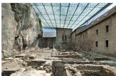
Site archéologique du Martolet: huit églises se sont succédé là depuis le IV e siècle.