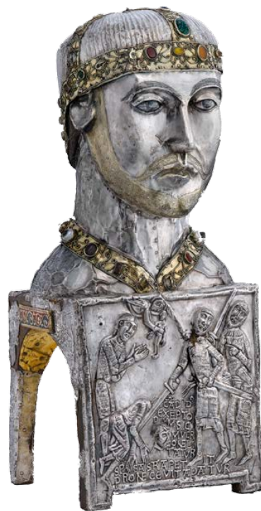
Reliquaire du chef de saint Candide, vers 1165. Trésor de l'abbaye de Saint-Maurice.