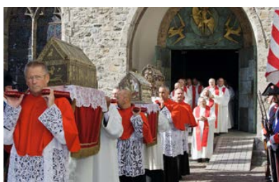
La messe de la fête de Saint-Maurice sera suivie d'une procession des reliques du saint.

Le 22 septembre 2015, la Poste sera présente au Marché monastique de Saint-Maurice sous la forme d'un bureau de poste spécial. D'autres informations suivront dans La Loupe 2/15 et sous poste.ch/timbres-poste > Agenda