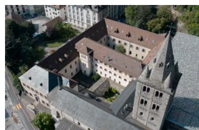
Vue aérienne de l'abbaye de Saint-Maurice.