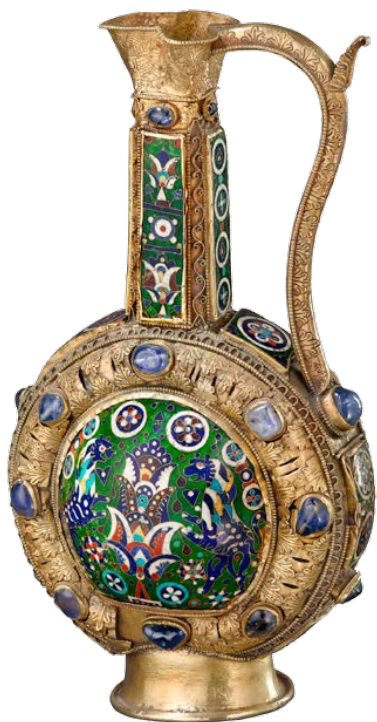
L'«aiguière de Charlemagne», milieu du IX e siècle. Trésor de l'abbaye de Saint-Maurice.